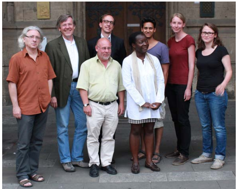
Ein Teil des Organisationsteams der Ringvorlesung 2012.

Wir danken – last, not least – allen Referentinnen und Referenten, die die Ringvorlesung zu so einem großen Erfolg haben werden lassen.